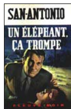
SP N°697 30.04.1970 ** Imp. Bussière N° 645 - 20 mm