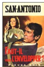
SP N°709 20.04.1970 ** Imp. Bussière N° 646 - 20 mm

** Edition originale et réédition avec la même couverture