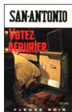
SP N°391 2 e trim 1969 Imp. art. Monaco Réalisé P.I.E. - 18 mm

- 20 mm "pub. mens." au recto ou verso dernière page