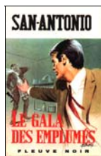
SP N°385 1 er trim 1969 Imp. art. Monaco Réalisé P.I.E. - 18 mm - 20 mm