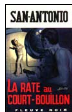
SP N°443 3 e trim 1969 Imp. art. Monaco Réalisé P.I.E. - 18 mm - 20 mm