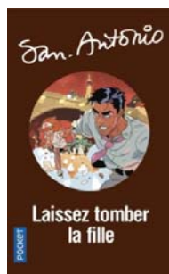
SA N°2-2018 Numéroté 43