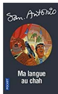
SA N°73-2018 Numéroté 90