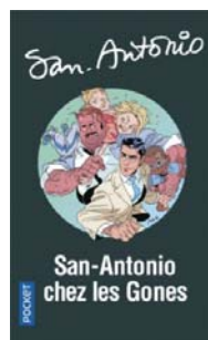
SA N°51-2018 Numéroté 13