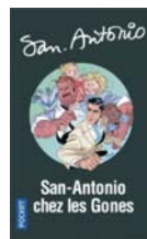
SA N°51-2018 Numéroté 13