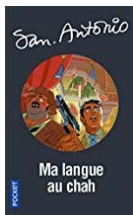
SA N°73-2018 Numéroté 90