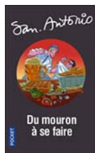
SA N°17-2018 Numéroté 57